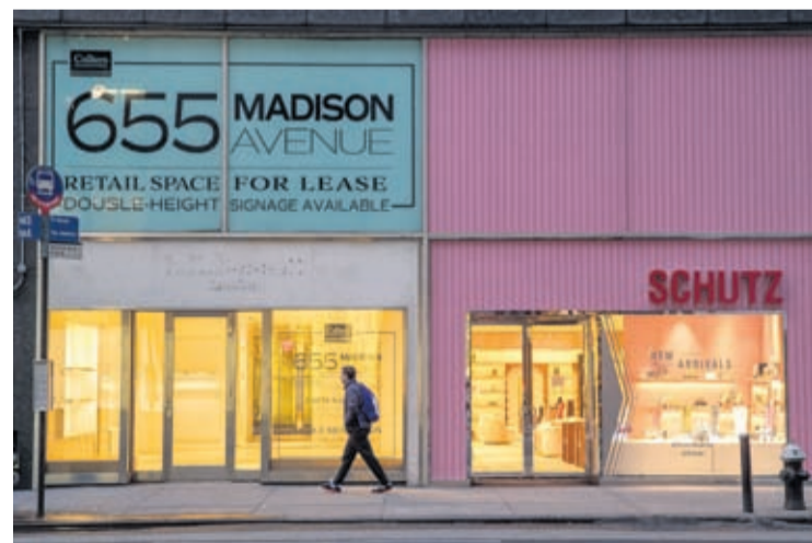
In this Thursday, March 19, 2020, file photo, a pedestrian walks past a storefront for rent on Madison Avenue, in New York.